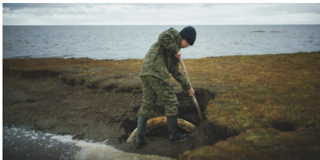
Der schmelzende Tundra-Permafrost gibt Mammut-Elfenbein frei

PRESENTING PARTNER: CITYKIRCHE OFFENER ST. JAKOB